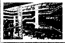
◆ Hall-1 世貿中心一館

簡稱「展覽一館」，樓高7層，總樓層面積15萬9,329平方公尺，自1986年啓用以來，配合台灣產業的發展腳步，成功地辦理各項長、短期專業展覽，是亞洲地區最活躍的展覽場之一。